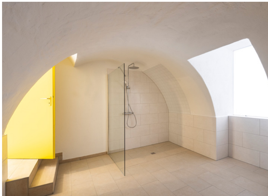
Im ehemaligen Gewölbekeller, heute Bad, schließen eine Wand und eine Milchglasscheibe den früheren Zugang zum Pool.

Praktisch: Neben der ebenfalls mit massivem Eichenholz belegten Falltreppe , von der man wiederum in die Küche gelangt, ist eine weiß lackierte Sitztreppe angeordnet. „Zum Zeitunlesen oder auch mal mit dem